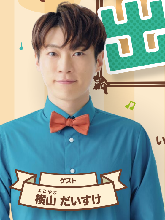
ゲスト よこやま 横山 だいすけ