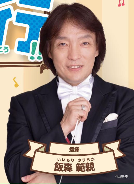
指揮 いもり のりちか 飯森 範親

オーケストラのコンサートは ワクワクする音楽でいっぱい! いろいろな音があふれるジャングルを みんなで探検してみよう!